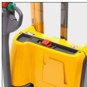
Posibilidades para guardar lápices, cúter y documentos.