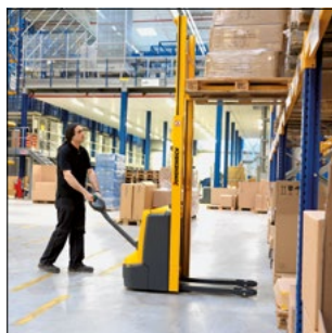
Buena visión a la carga para un posicionamiento exacto