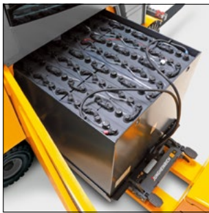
Cambio de batería por el lateral