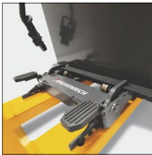
Gestión profesional de la batería