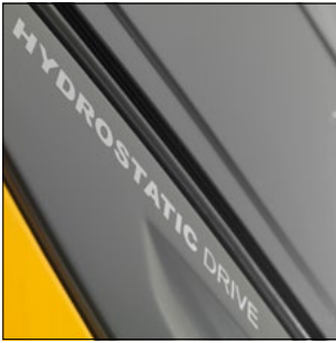
El mejor rendimiento de despacho