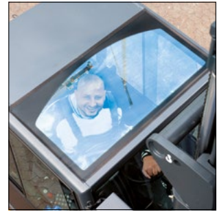
Excelente visibilidad en todas las direcciones