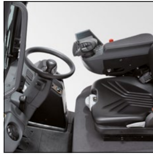
Puesto de trabajo cómodo y que fomenta el rendimiento