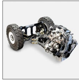
Motores VW con valores de consumo bajos