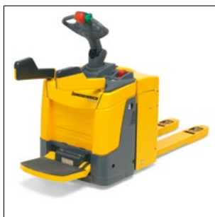
ERE 225 con plataforma abatible