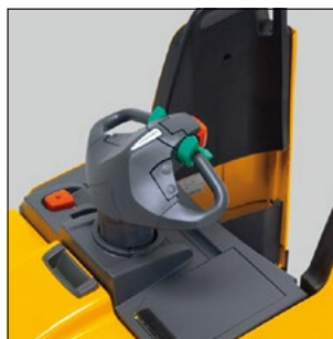
Puesto de trabajo confortable