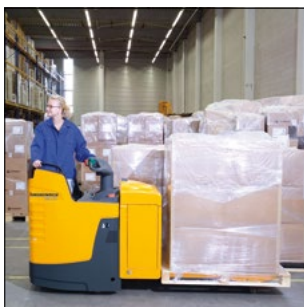
Traslación en dirección del grupo de tracción