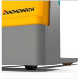
Gran seguridad gracias a una escasa altura con respecto al suelo