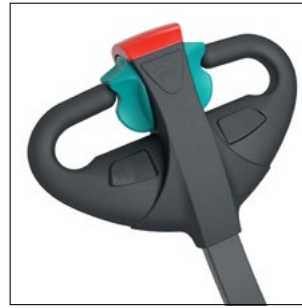
Cabezal ergonómico de la barra timón