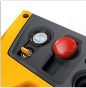
Alineación centralizada de los instrumentos de control