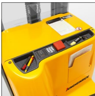
Diversas bandejas cubeta para tener los utensilios de trabajo a mano