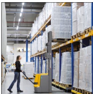
Apilado de la carga exacto y fácil