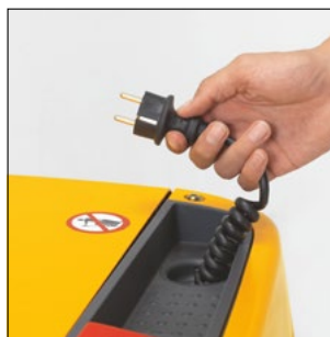
Cargador integrado también para baterías más grandes